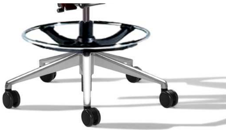
Reposapiés con aro cromado