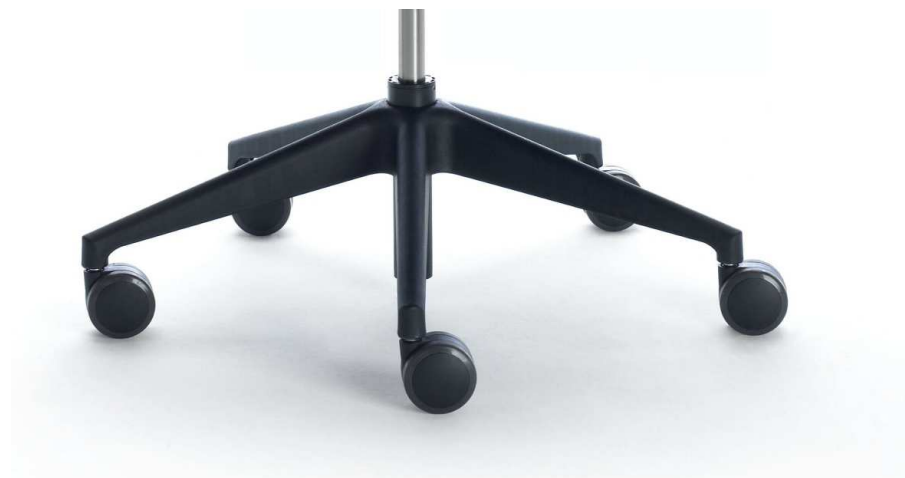
Base en poliamida negra