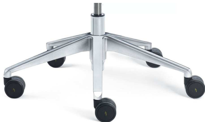
Base en aluminio