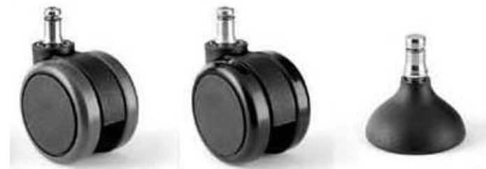
Ruedas de rodadura duras, blancas o topes.